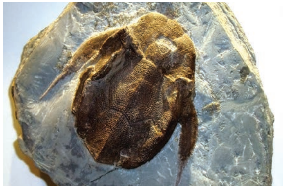
上：長さ8キロ、幅1キロの面積を持つミグアシャ国立公園は、脊椎動物の化石が埋まった岩層を保護するために1985年に州立公園に指定された