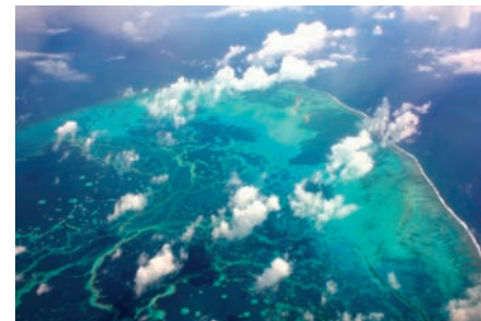
上/サンゴ礁の周りでは無数の魚が泳ぎ回る 左下/絶滅危惧種に指定されているモンクアザラシ 右下/青い海に広がる美しいサンゴ礁は空からもうかがえる